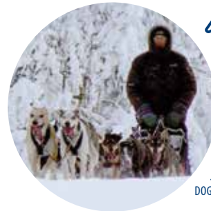
Salva Luque DOGS TEAM SALVA

Minimiza las microroturas musculares y consigue que los perros estén más dispuestos a seguir corriendo